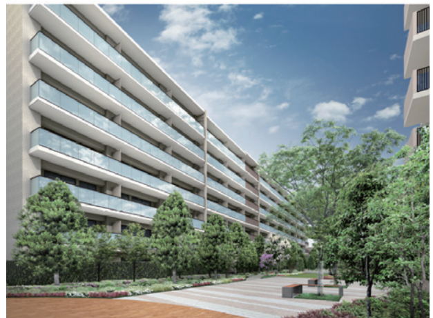
※ 2023年着工、2025年竣工予定（施行再建マンション）