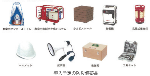
導入予定の防災備蓄品